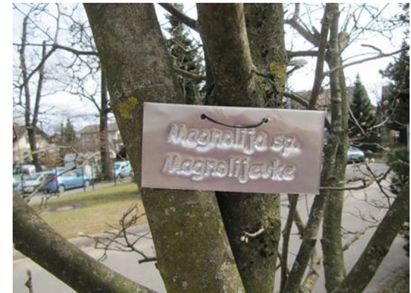
Informativna tablica drevesa

Veveričkova učna pot ima 15 informacijskih točk oz. postaj z nalogami za različne starostne skupine. Ob tem boste odkrili, da je izobraževanje s pomočjo poskusov, merjenja, prepoznavanja rastlinskega in živalskega sveta lahko tudi zabavno. Na učni poti sta tudi dve ptičji krmilnici.