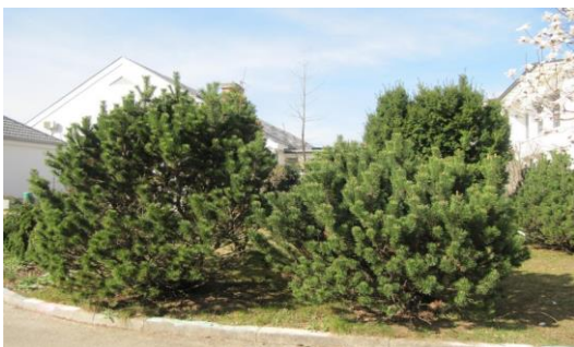
Osnovna šola Orehek Kranj